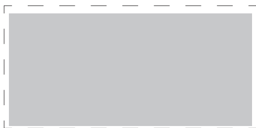
1:1 Vorlage auf Seite 2